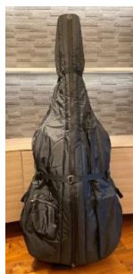
【バス弦】 スズキオリジナル